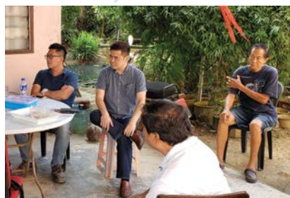
Sg Limbat- 考察会议 - 商讨防减灾计划