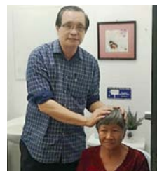
2019年10月，黎家姐姐洗礼了

“我的伤口一直不会好，都8年了。”姐姐望着包扎绷带的右脚，无奈地说。现在，由于距离关系，加上脚伤，姐姐无法每个星期参加教会主日崇拜。志工们则每个月一次到姐姐家里小组团契，一起唱诗赞美及分享神的话语。