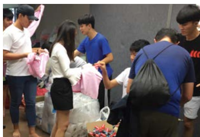
在居銮益人社会服务中心包装卫生包