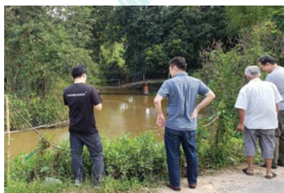
Sg Limbat- 考察队正在考察村庄后的河床侵蚀度