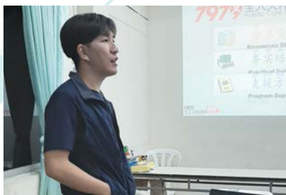
在居銮给予赈灾解说