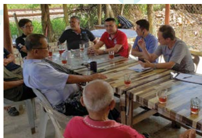
Temangan- 考察会议 - 商讨防减灾计划